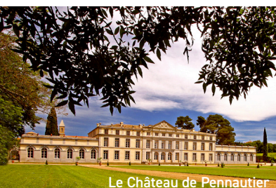
Le Château de Pennautier